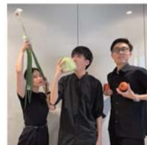
野菜をもって、チーム写真を撮る