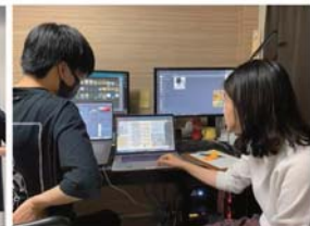
徹夜しながら提案を考えました