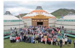
米山学友による第2回世界大会